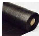
MALLA ANTIHERBA, FILM Y FILM NEGRO